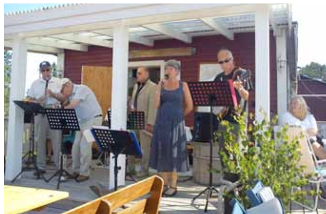
Jazz på Lotsstugan – Pilot Station Jazz Band.