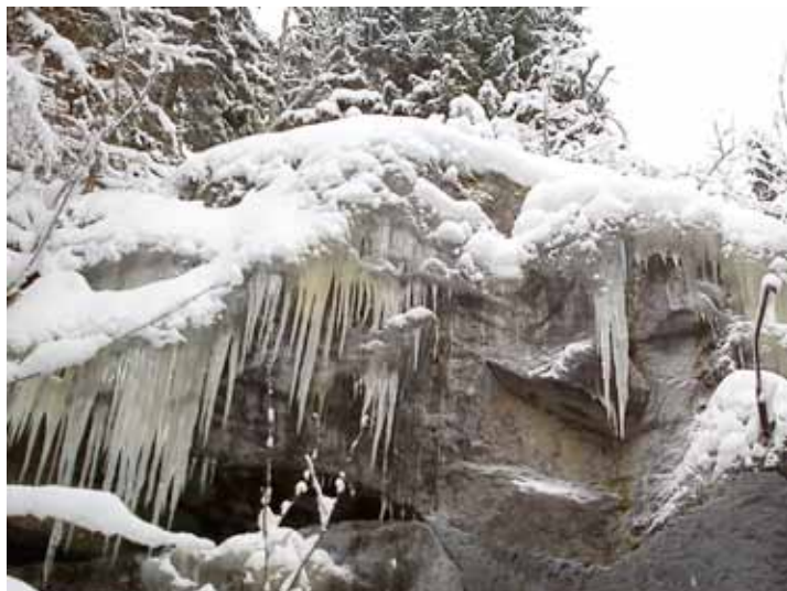
Istappsprydd grotta utanför Härnösand.

Om vi hade rekordvinter i fjol, så fick vi vänta desto längre på snö och kyla den här säsongen. Mindre trevliga var ett par stormar, som härjade vilt. Den senaste, Dagmar, åstadkom mycken skada, framför allt i våra skogar. Men nu (senare delen av februari) är det perfekt – fint skidföre och lagom kallt. Och ljuset återvänder sakta men stadigt.